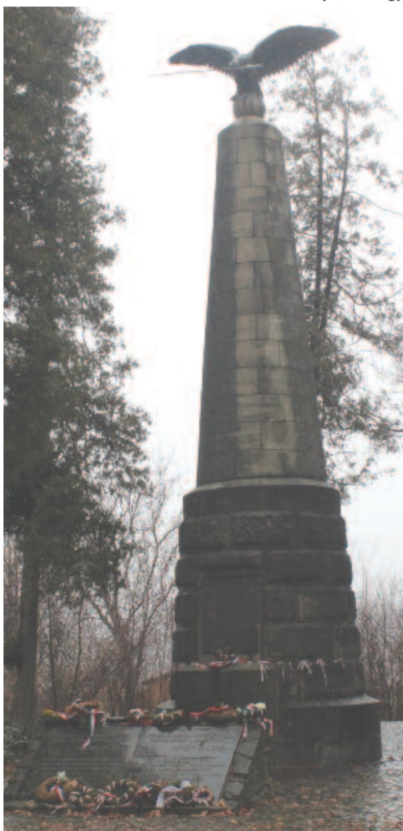
A turulmadaras emlékmű

A korabeli szemtanúk a kúttól kissé nyugatra lévő Sárpatok-hídon látták utoljára Petőfi Sándort, és úgy tartják, az ütközet feltételezett színhelyén, az Ispánkútnál esett el. Az Ispánkút fölé, az 1867-es kiegyezés után emeltek egy Petőfi-emlékművet, de ezt a trianoni döntés után lerombolták. Ennek talapzatát a református egyháznak sikerült megmentenie és a marosvásárhelyi református temetőbe menekítenie. 1969-ben, Petőfi halálának 120. évfordulójára készült el a mai piramisszerű emlékmű, melynek nyugati oldalára felkerült Hunyadi László szobrász kőbe faragott Petőfi-domborműve, melyet Sütő András író és más marosvásárhelyi értelmiségiek kezdeményezésére állítottak. Az 1990. márciusi erdélyi, felszított magyarellenes hangulatban a domborművet vandál kezek megromlalták, és az emlékművet meggyalázták. Fehéregyházán ma is csonkán áll. 2005 nyarán avatták újra az emlékművet, és ekkor leplezték le a Gyarmathy János marosvásárhelyi szobrász által megmintázott bronzplakettet, melyet az emlékmű északi, főút felőli oldalán helyeztek el.