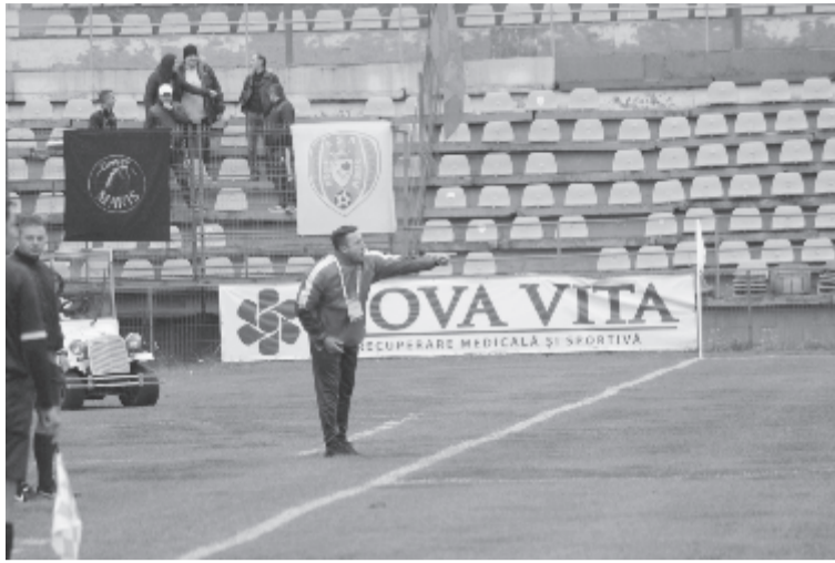
Lassan elfogyott minden a marosvásárhelyi klubnál: a közönség, aztán a játékosok, végül az elmúlt év utolsó mérkőzéseit levezénylő szakmai stáb tagjai sem tértek vissza a Sziget utcába.