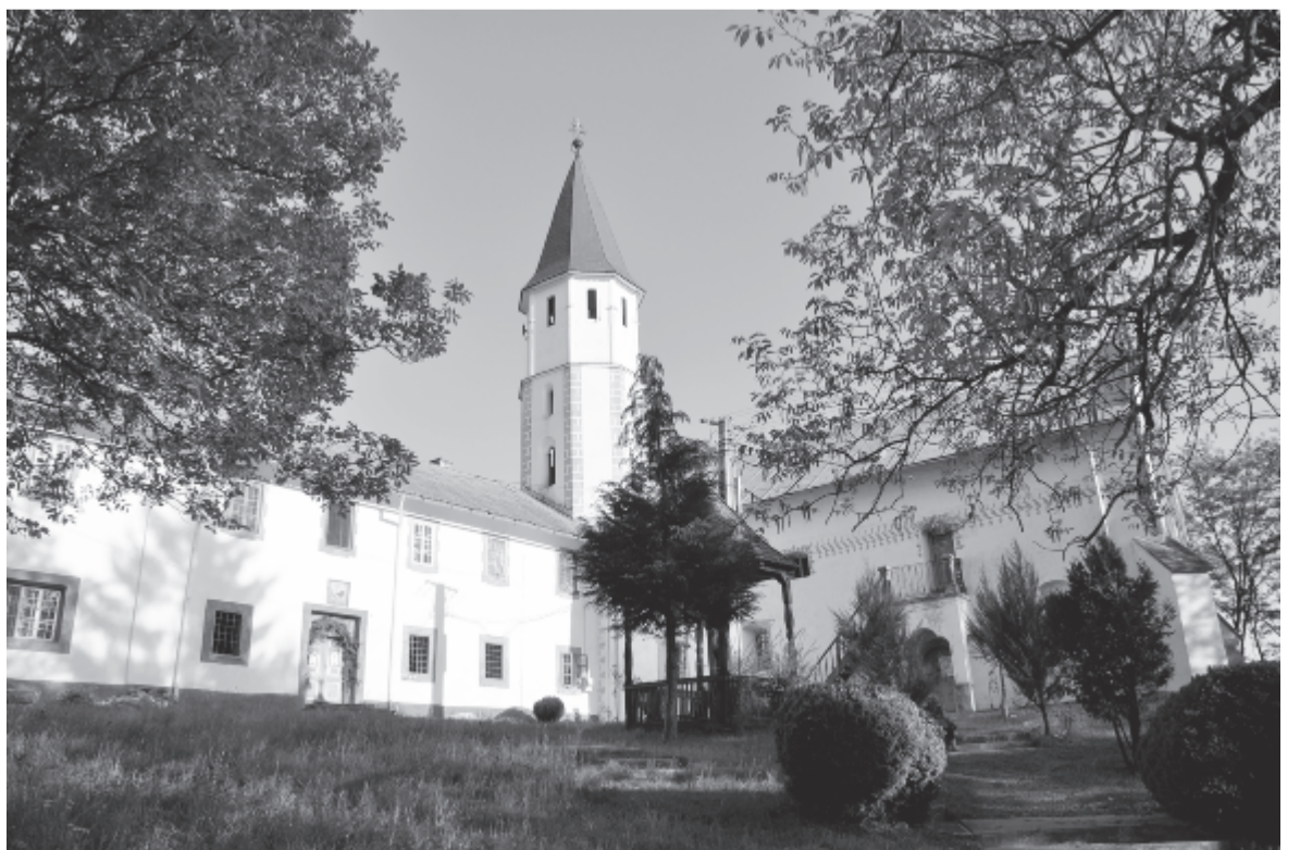
Az egykori mikházi ferences kolostor épülete