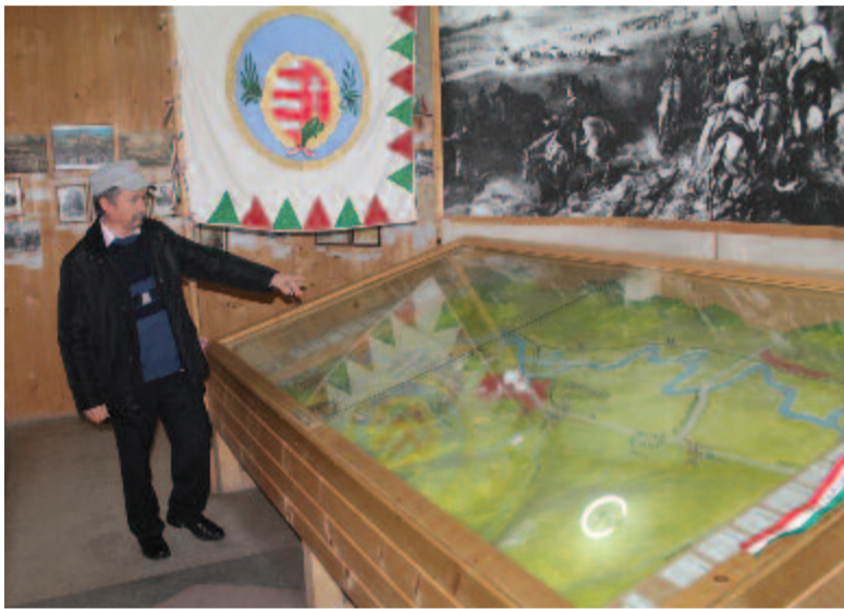
A segesvári csatátér makettje

Egy héttel ezelőtt a segesvári várat vettük szemügyre. Ebben a részben az 1849. július 31-i segesvári (fehéregyházi) csatához és az ott elesett Petőfi Sándor emlékéhez fűződő helyekről írunk.